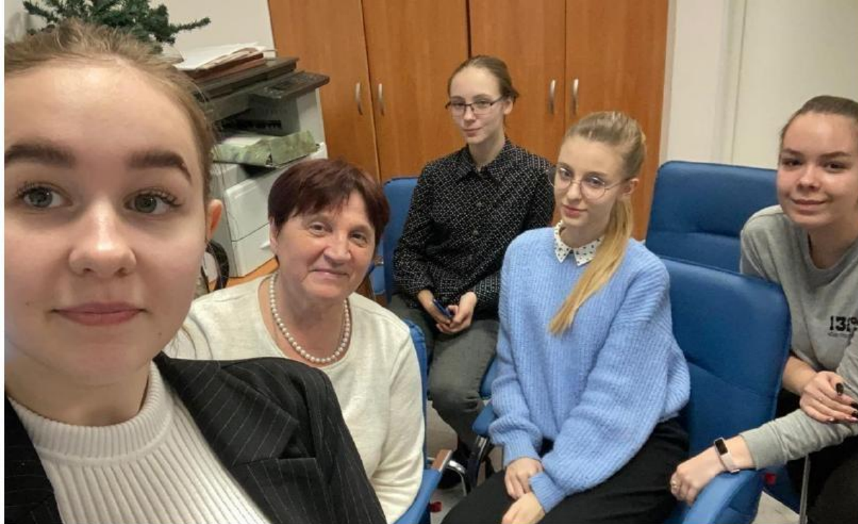
Новосибирская гимназия 17 – на проводе