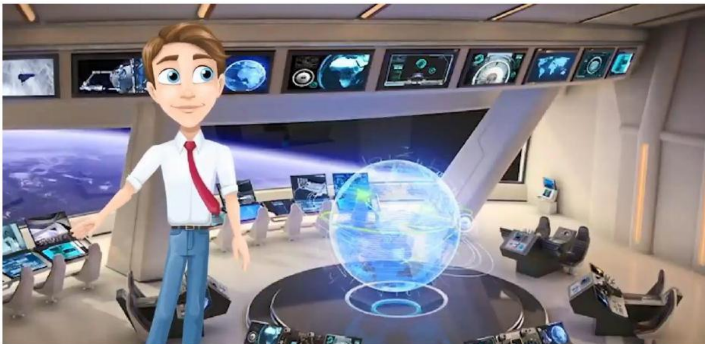
Информитя – искусственный интеллект авиакомпании НАШпресс

Звание Абсолютного победителя Конкурса присвоено редакции газеты «Контакт!» столичной школы 1259, среди дипломантов и призеров высшей печатной лиги Конкурса – редакции лицея 11 (Челябинск), школы-интерната 38 (Ростов-на-Дону), лицея 67 (Иваново), гимназии 177 (Екатеринбург), классической гимназии 17 (Новосибирск), образовательного центра «Горностай» (Новосибирск), Долгопрудненской гимназии.