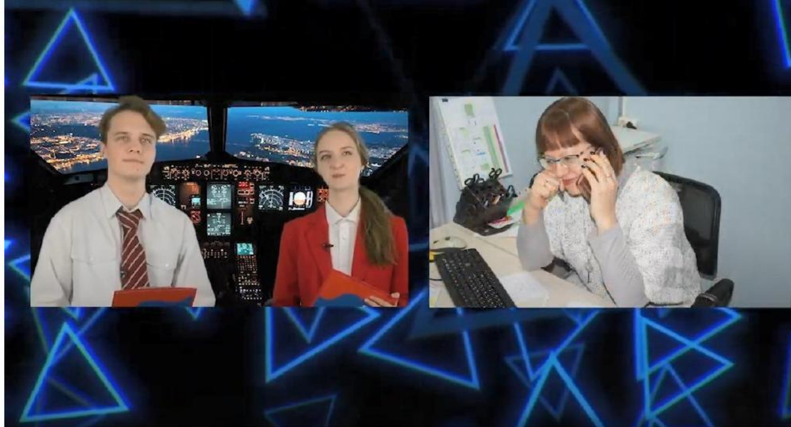
На связи – Самара (гимназия Перспектива)