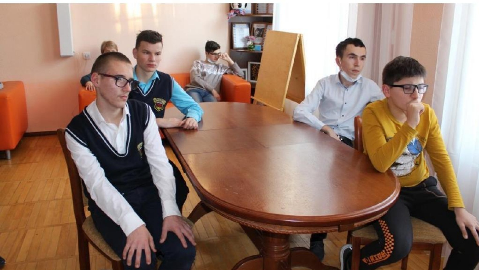
Зрительный онлайн зал в Ростове-на-Дону (специальная школа-интернат 38)