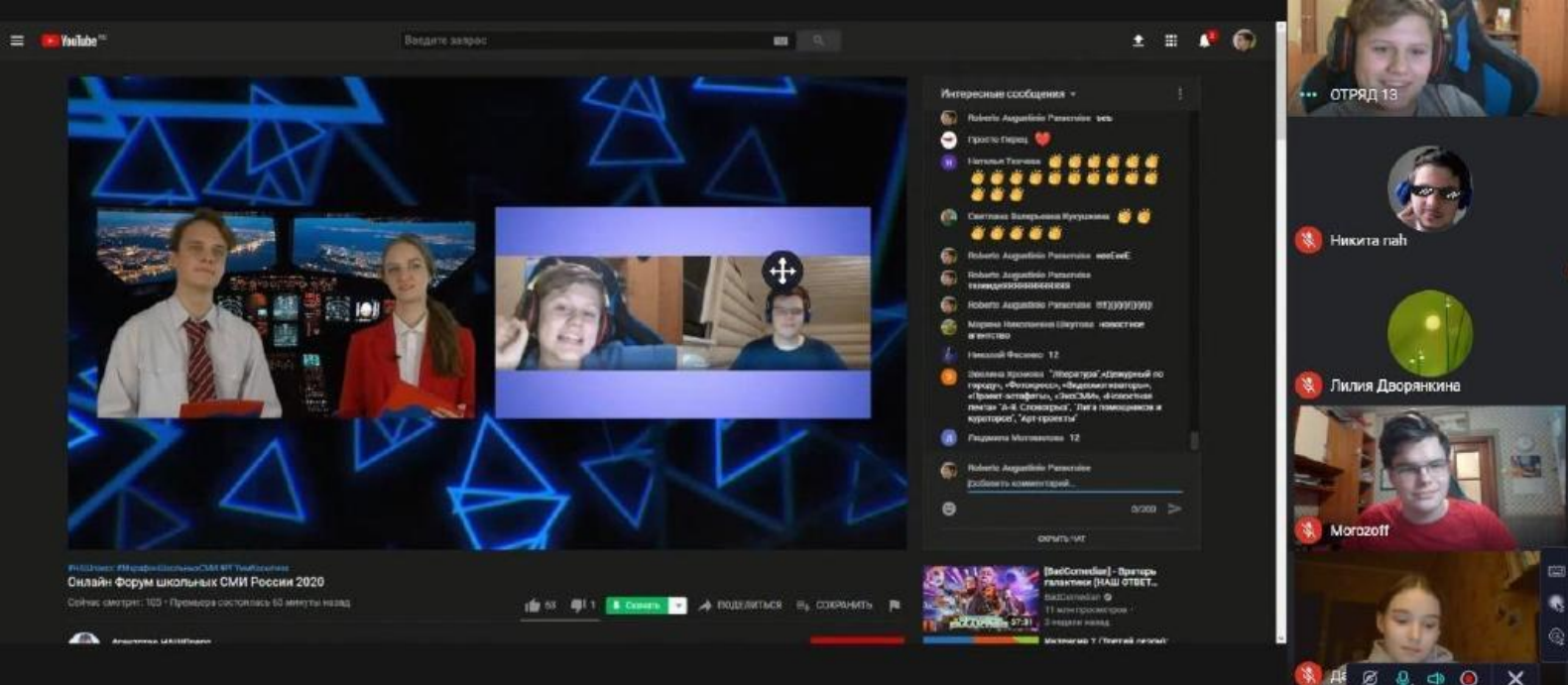
Зуммолет залетел в детскую студию «ТелеИдея» (школа 1329, Москва)

Информационную и методическую поддержку форуму много лет оказывает Координационный центр доменов RU/РФ.