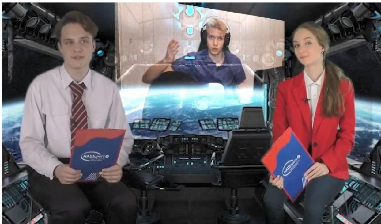
На связи – школа 1354, Москва

Особый пункт программы – премьера гимна юных журналистов России. Видеоклип объединяет фрагменты эстафетных роликов детско-юношеских пресс-центров страны (которые также делались по специальному ТЗ, предусматривающему коллективную работу над единым медиапродуктом).